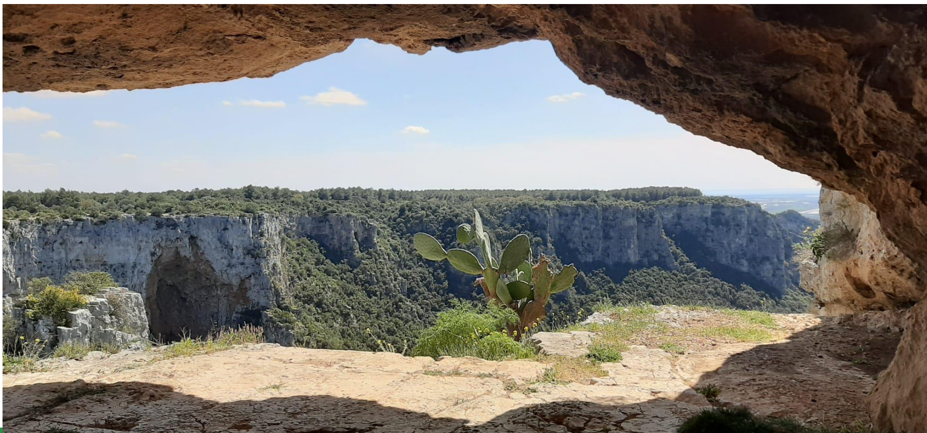
Foto scattata dall'interno della Grotta Bassa. L'immagine riporta uno spaccato della Gravina di Laterza dove si intravedono alcune piante tipiche dell'habitat come le ginestre, la ferula e il fico d'india.