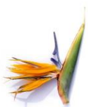
Strelitzia reginae Jacq.