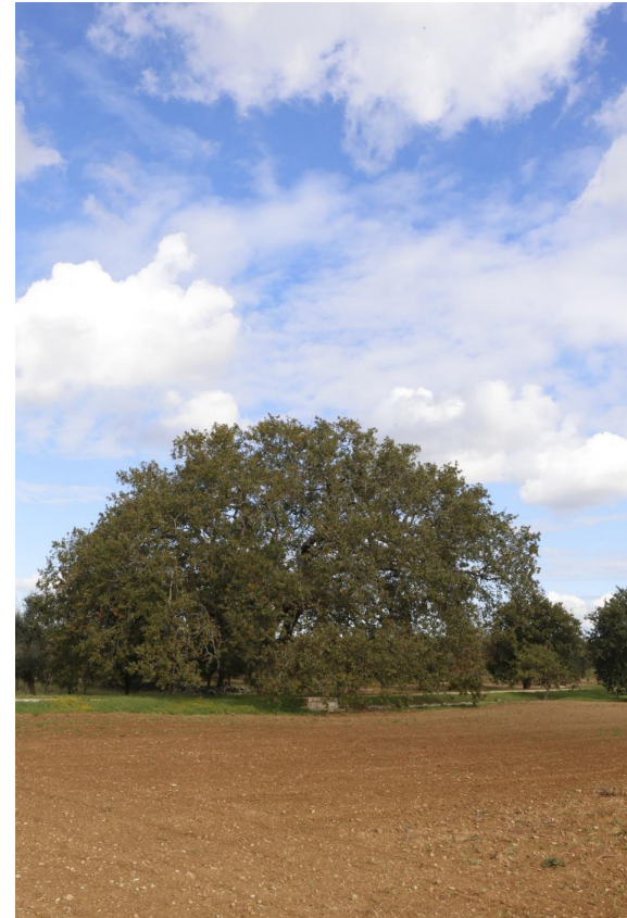
“Quercia di Macrì”- Supersano (LE) Id 001/L008/LE/16

Al momento sono stati censiti 144 alberi monumentali in Puglia