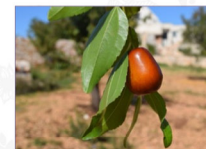
Giuggiolo: Ziziphus jujuba Mill. Varietà A Pera