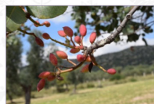
Pistacchio: Pistacia vera L. Varietà Del Gargano