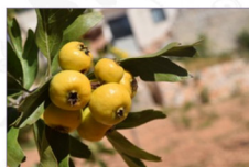
Azzerruolo: Craetagus azarolus L. Varietà Giallo