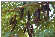
Carrubo: Ceratonia siliqua L. Varietà A Mele

Sono stati recuperati in totale 92 genotipi di fruttiferi minori (azzerruolo 5, carrubo 3, castagno 5, corniolo 2, corbezzolo 3, cotogno 6, fico d'India 3, gelso 6, giuggiolo 3, kaki 2, melograno 21, nespolo europeo 7, nespolo del Giappone 1, noce 7, nocciolo 4, pistacchio 1, sambuco 2, sorbo 3, uva spina 2). Per ogni accessione sono stati eseguiti i diversi rilievi carpometrici e fotografici per la realizzazione delle schede pomologiche. È stato inoltre raccolto il materiale di propagazione per l'inserimento presso i campi collezione. La descrizione ed il confronto tra le differenti accessioni individuate ha consentito di verificare l'identità varietale. La caratterizzazione genetica ha permesso inoltre l'individuazione di casi di sinonimia e omonimia, nonché la costruzione di una banca dati con i profili di tutte le accessioni saggiate e l'ottenimento di diversi alberi filogenetici.