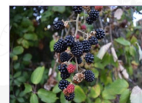
Rovo: Rubus ulmifolius L. Ecotipo di Ceglie Messapica (Br)