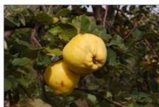
Cotogno: Cydonia oblonga Mill. Varietà Mollesca