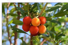
Corbezzolo: Arbutus unedo L. Ecotipo di Martina Franca (Ta)