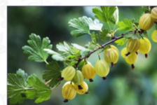
Uva spina: Ribes uva-crispa L. Ecotipo di Gioia del Colle (Ba)