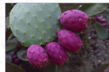
Fico d'India: Opuntia ficus-indica L. Varietà sanguigno