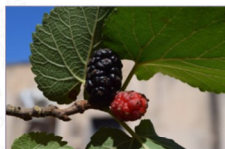
Gelso nero: Morus nigra L. Varietà Nero di Otranto