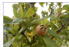
Nespolo europeo: Mespilus germanica L. Ecotipo piccolo