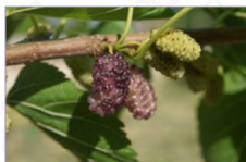
Gelso bianco: Morus alba L. Varietà Molinaro