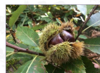
Castagno: Castanea sativa Mill. Varietà Gagnolido