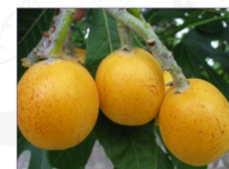
Nespolo del Giappone: Eriobotrya japonica Thunb., Lindl. Ecotipo Tondo