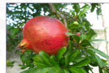
Melograno: Punica granatum L. Varietà Dente di cavallo