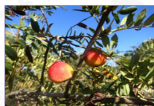
Sorbo: Sorbus domestica L. Ecotipo Tondo