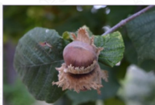
Nocciolo: Corylus avellana L. Varietà Tonda