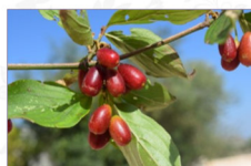
Corniolo: Cornus mas L. Ecotipo dei Monti Dauni