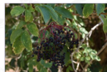
Sambuco: Sambucus nigra L. Ecotipo di Serracapriola (Fg)