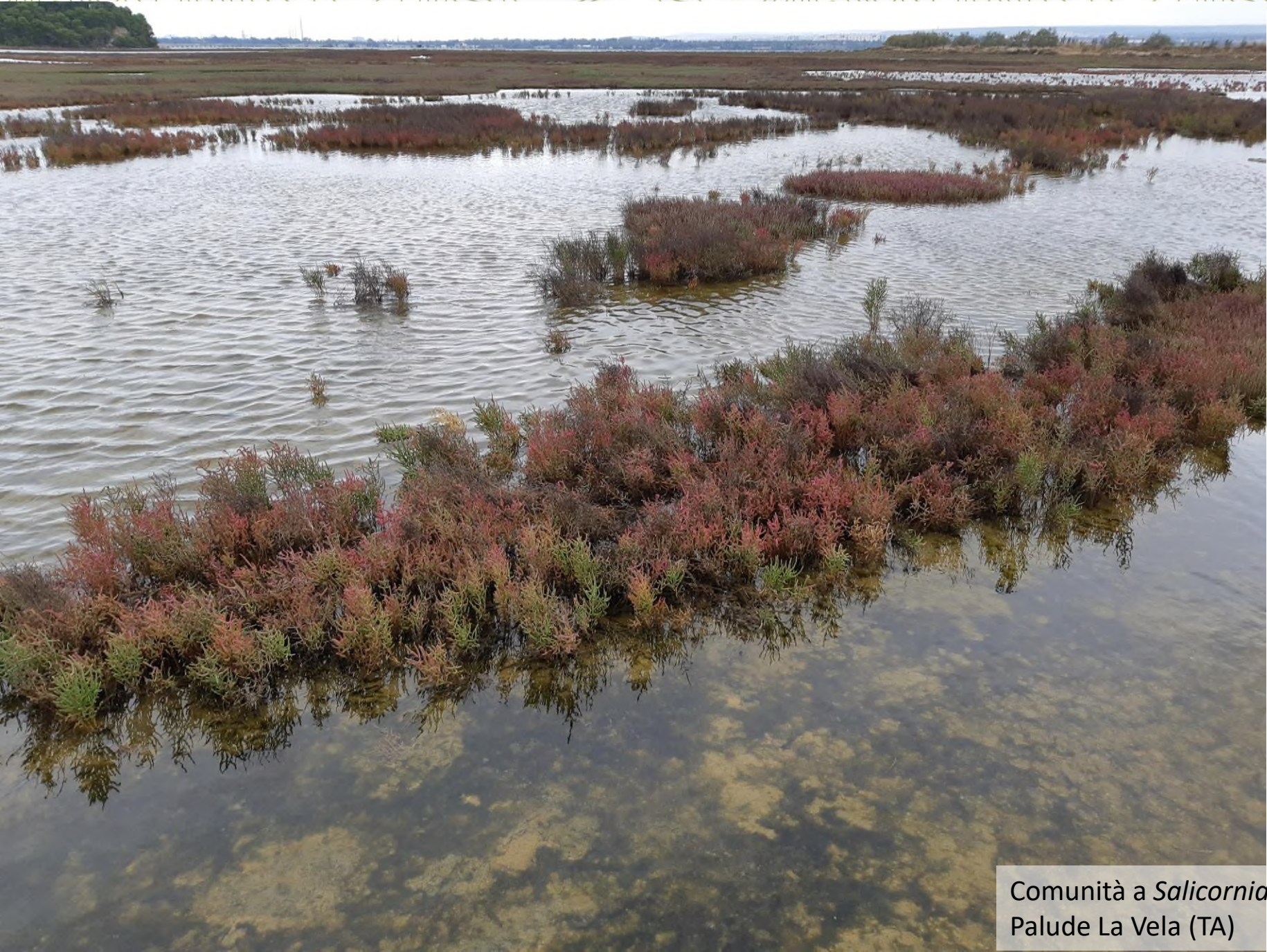
Comunità a Salicornia emerici Duval-Jouve Palude La Vela (TA)