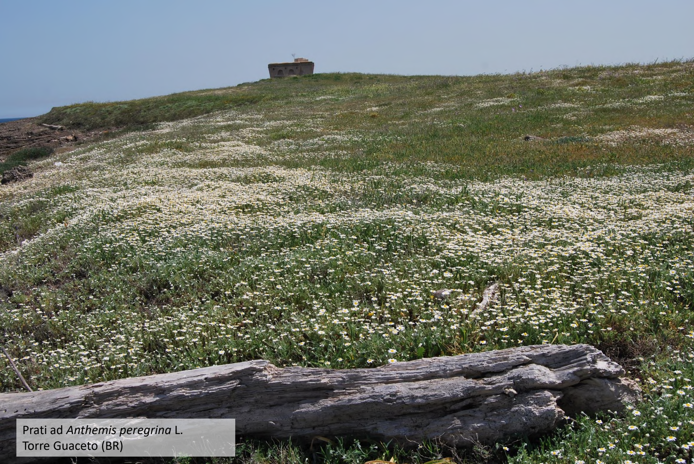
Prati ad Anthemis peregrina L. Torre Guaceto (BR)