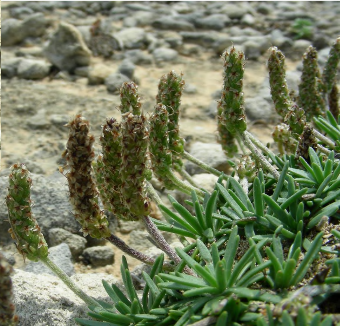
Plantago grovesii Brullo Torre dell'Orso (LE)