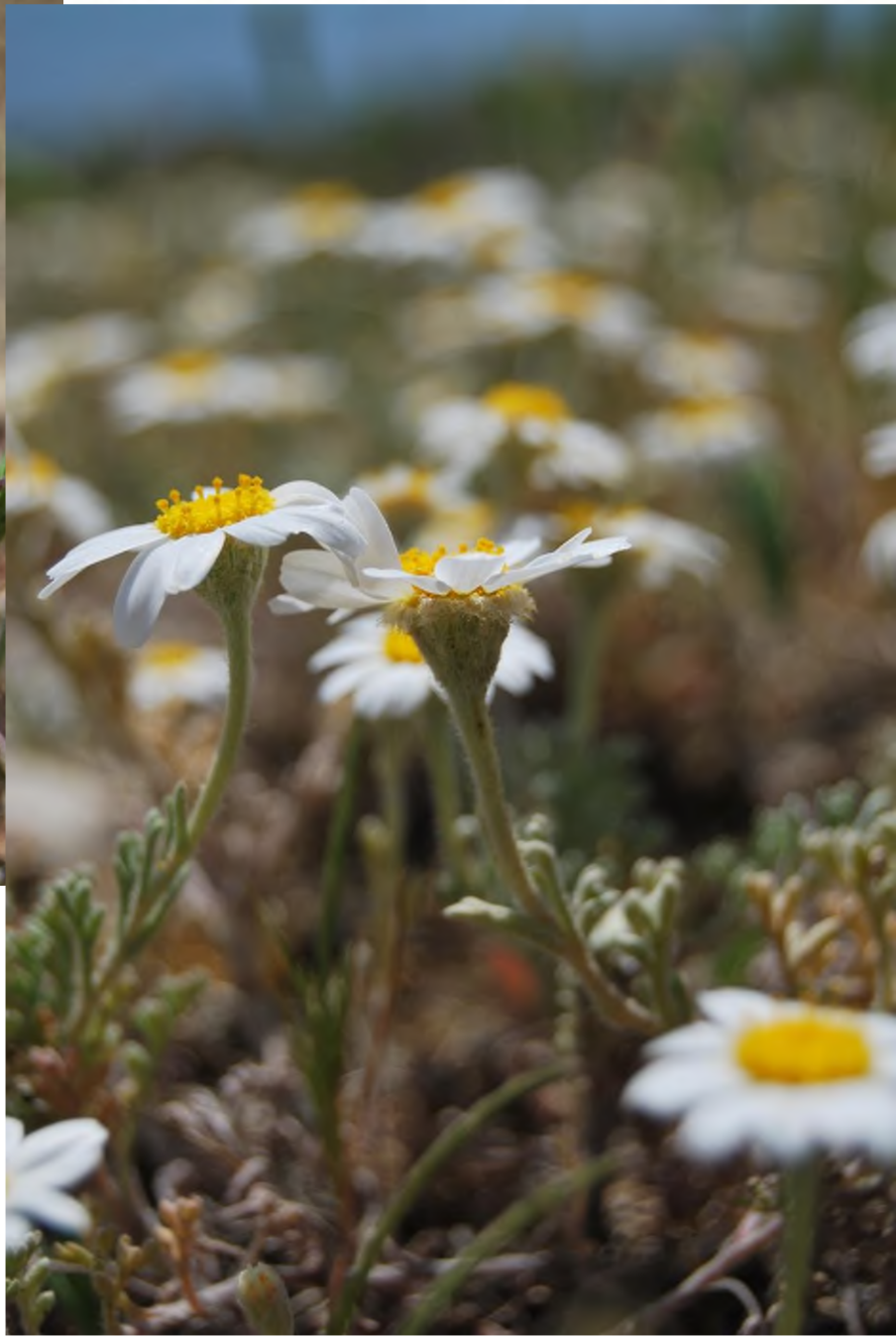
Anthemis peregrina L. Torre Guaceto (BR)