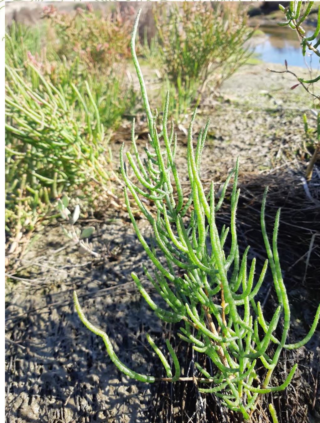
Salicornia dolichostachya Moss Palude La Vela (TA)