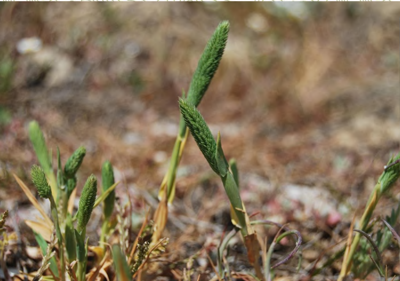
Phleum arenarium L. Torre Guaceto (BR)