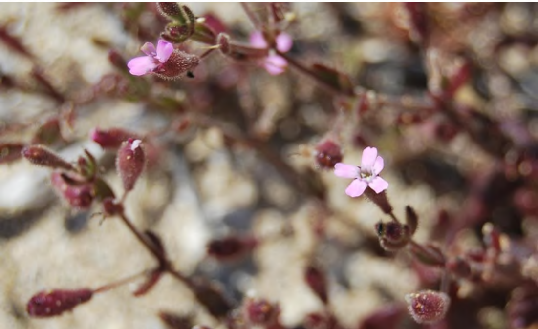
Silene sedoides Poir. Marina di Novaglie (LE)