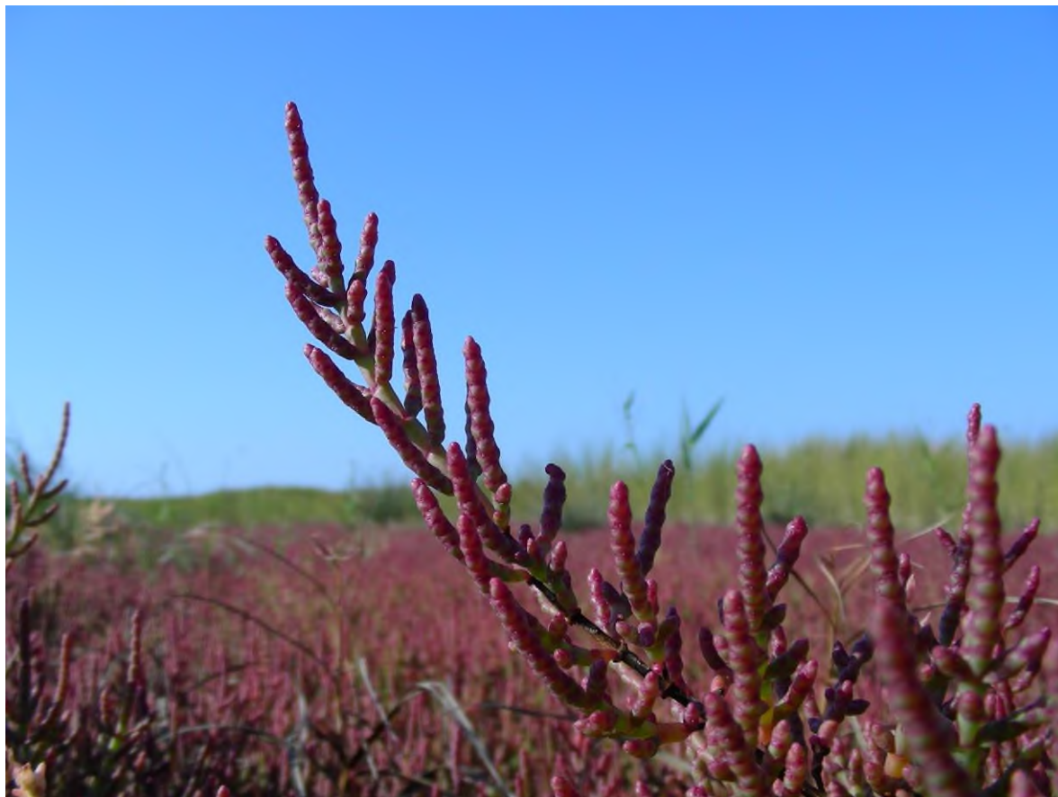
Salicornia patula Duval-Jouve Le Cesine (LE)