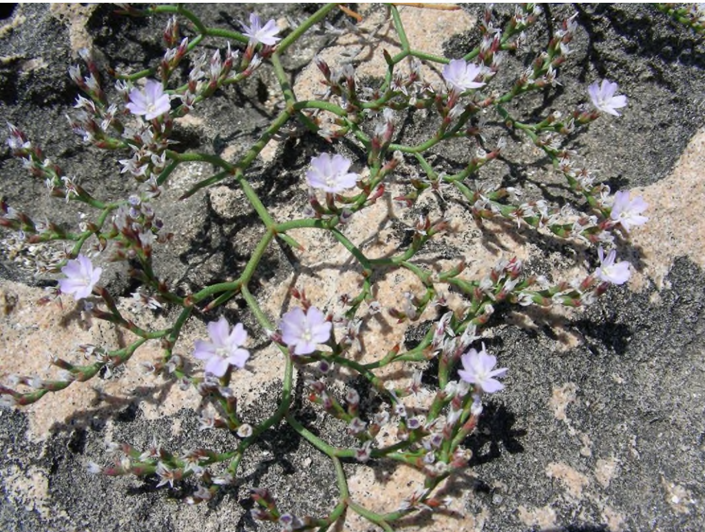
Limonium apulum Brullo Torre Guaceto (BR)